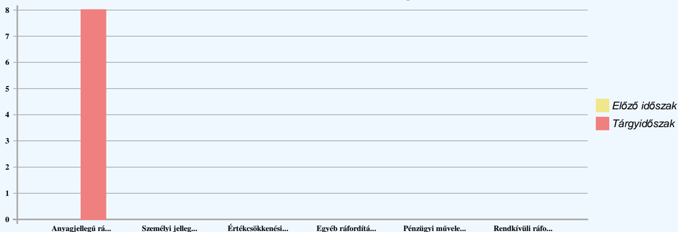
Ráfordítások alakulása és megoszlása