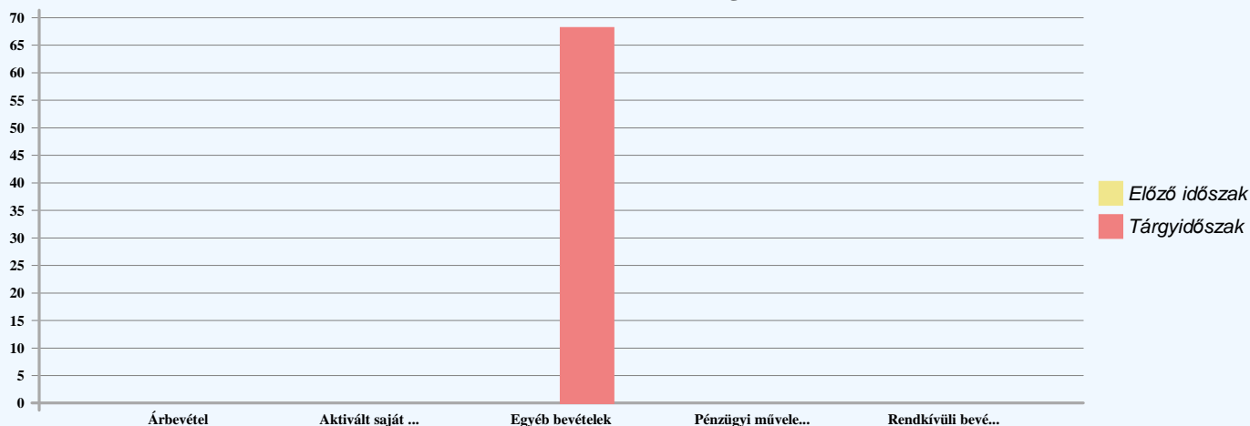
Bevételek alakulása és megoszlása